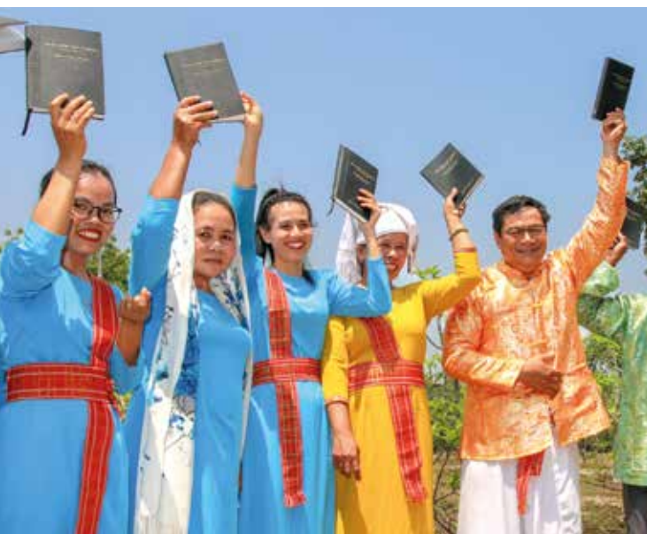
L'Église cham au Vietnam a reçu en mars 2024 les tout premiers exemplaires du Nouveau Testament en cham.

La Société biblique vietnamienne (SBV) a elle aussi une raison de se réjouir. En mars 2024, s'est tenue l'inauguration du Nouveau Testament destiné à la communauté cham orientale, un groupe ethnique qui vit principalement dans les régions côtières du centre-sud du pays. Il s'agit d'une étape importante pour cette communauté, qui a désormais accès aux Écritures dans sa langue, le cham. Ce projet a duré sept longues années, en raison notamment de restrictions financières et de nombreux problèmes rencontrés dans le travail de traduction.