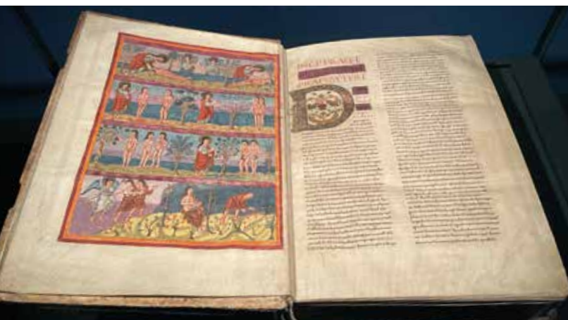
La Bible de Moutier-Grandval, exposée au Musée jurassien d'art et d'histoire à Delémont.

Jusqu'au 8 juin, le Musée jurassien d'art et d'histoire de Delémont expose la Bible de Moutier-Grandval, normalement conservée sous haute protection à la Bibliothèque nationale britannique à Londres. L'équipe de la Société biblique suisse n'a pas manqué l'occasion d'admirer l'un des plus beaux manuscrits du monde. Quelques impressions :