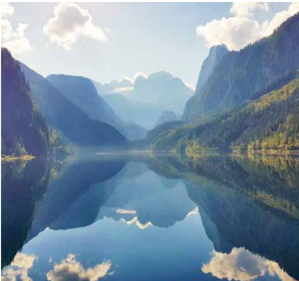
Bibelsonntag 2022: JHWH freue sich über seine Geschöpfe (Ps 104)