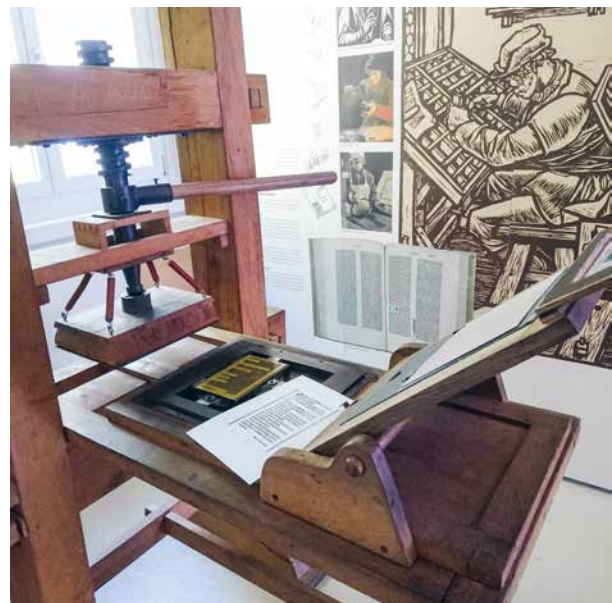
Unterweisungsklassen können mit unserer Gutenbergpresse den Ps 23 oder Spr 21,21 drucken

Die Markensammelstelle wurde im Berichtsjahr im Haus weitergeführt. Insbesondere die Vorsortierung und der Versand von Massenware wurden fortgeführt. Die Bewerbung und der Verkauf von speziellen Marken und Sammlungen müsste jedoch in fachkundige Hände abgegeben werden. Die intensive Suche führte bisher nicht zu geeigneten Lösungen und wird fortgesetzt.