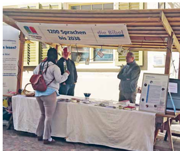
Stand am Bodensee Kirchentag 2022

Die Webseite wurde weiter überarbeitet und aktualisiert, um den Informationsgehalt und die Attraktivität der Seite zu steigern und sie modernen