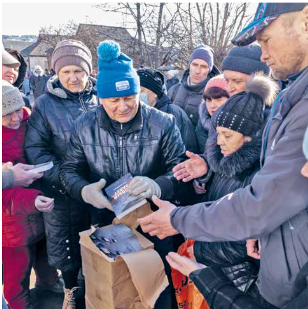
Bibelverteilung für die ukrainische Bevölkerung

Die SB trug im Berichtsjahr mit rund CHF 46'000 zur generellen Arbeit des Weltbundes bei. Daneben wurden folgende bibelgesellschaftliche Projekte mit einem Gesamtbetrag von gut CHF 80'000 unterstützt: