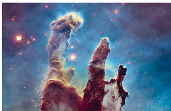
Säulen der Schöpfung im Adlernebel

Weitere drei Veranstaltungen sind für 2023 geplant. Die Vorträge werden aufgezeichnet und können über die Webseite der SB und über den Youtube-Kanal ( www.youtube.com/@CH_Bibelgesellschaft ) abgerufen werden.