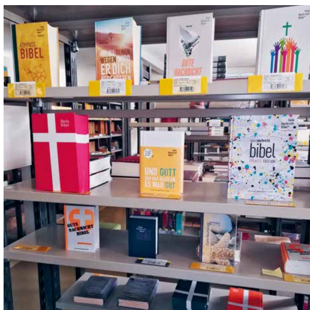
Bibeln im Lager der SB