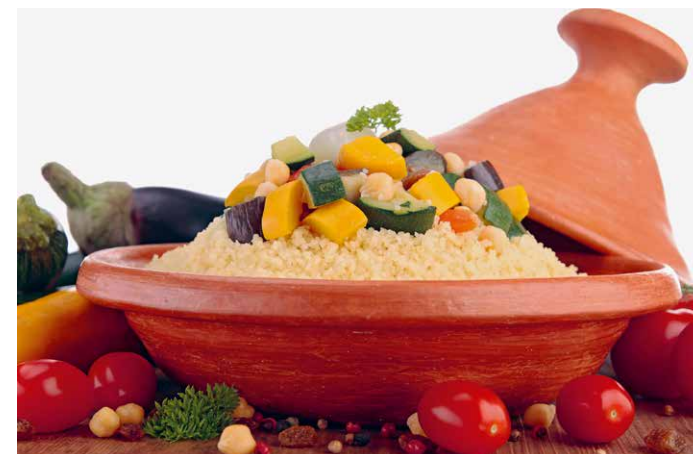
Le Dimanche de la Bible 2016 avait pour thème «Boire et manger dans la Bible».