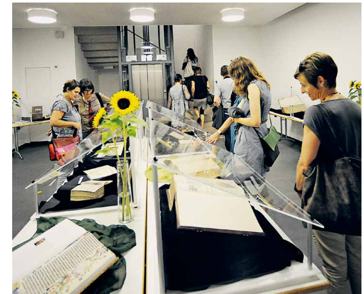
Avec son exposition sur les bibles pour enfants la SBS a participé à l'événement «Espace – Temps – Mondes de la Bible» des Eglises réformées Berne-Jura-Soleure.