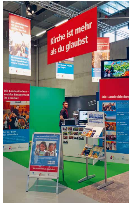
La SBS, hôte à la foire de printemps BEA 2016 à Berne.

Les Eglises réformées Berne-Jura-Soleure (refbejuso) ont organisé en ville de Berne et à leur siège l'événement majeur «Espace – Temps – Mondes de la Bible». Une partie de celui-ci était consacré au thème «Bibles pour enfants – En transition», où notre matériel d'exposition sur les bibles pour enfants a été présenté. Les nombreux visiteurs ont pu feuilleter environ quarante bibles publiées sur deux siècles et trouver beaucoup d'informations sur les panneaux de l'exposition.