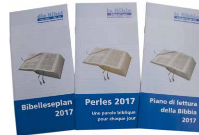
Pour la première fois en 2017, le plan de lectures bibliques de la SBS paraît aussi en italien.

La production de la version imprimée du très apprécié plan œcuménique de lectures bibliques fut en 2016 nettement différente par rapport aux éditions précédentes. Pour la première fois dans l'histoire de la SBS, la version allemande de 2017 est parue en collaboration avec l'Œuvre biblique catholique suisse et Missio, œuvre d'entraide catholique. Et, autre innovation, le plan de lectures bibliques est également paru en italien. L'effort supplémentaire investi en valait la peine et ces nouvelles coopérations seront développées ces prochaines années.